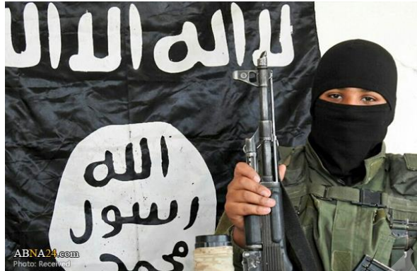
تصویر شماره ۵: ابو عمر العراقي، عامل حمله به سامرا عراق - تیر ۱۳۹۶

از تصاویر بررسی شده، پس‌زمینه تصویر عامل انتحاری در ۴۸ درصد (۲۴ مورد) شامل ادوات نظامی اعم از تانک و خودرو بمب‌گذاری شده، در ۲۸ درصد (۱۴ مورد) نیز پرچم سیاه‌رنگ داعش و در ۲۴ درصد (۱۲ مورد) غیر از آن است. فراوانی موقعیت‌های طبیعت نیز در تصاویر داعش قابل توجه است. نشانه‌ی پرچم سیاه‌رنگ داعش کاملاً در تصویر شماره ۵ نمایان است.