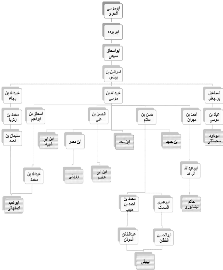
ترسیم شبکه اسناد بصری حلقه مشترک سندی (ب)

حبشه به شمار نیاورده‌اند (ابن عبدالبر، ۱۴۱۲: ۱۷۶۳/۴). ذهبی با اشاره به سند اخبار هجرت منتهی به وی، به شمار آوردن ابوموسی اشعری جزو مهاجران حبشه را وهم برخی از راویان دانسته است (ذهبی، ۲۰۰۳: ۵۸۲/۱). بنابراین به دلیل اینکه یکی از